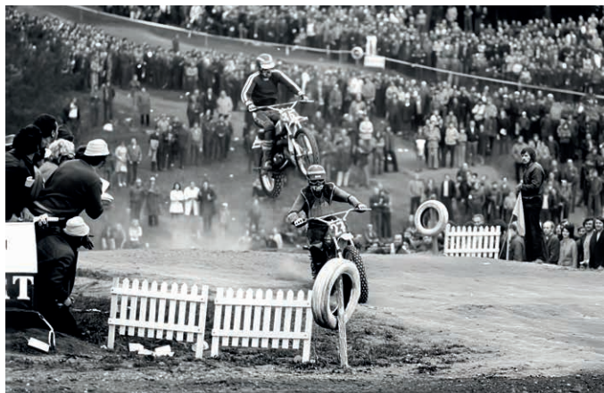
Atmosféra závodů byla skvělá.